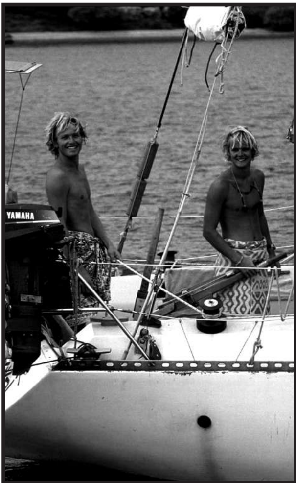
Everything's OK.