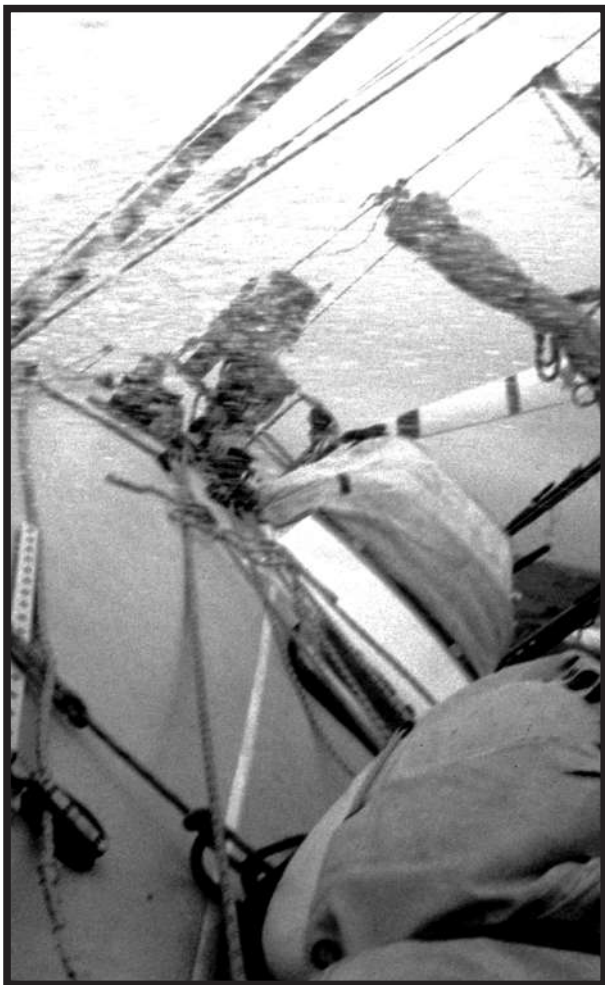
De første ukene over Nordsjøen var heller utrivelige. Alt var søkkvått, men vi var på vei.